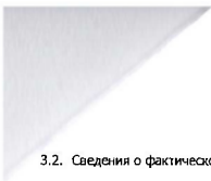
3.2. Сведения о фактическом достижении показателей, характеризующих объем муниципальной услуги: